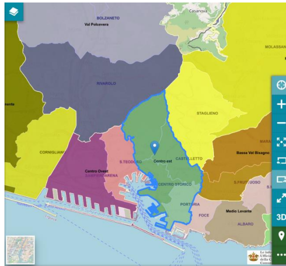
Municipio Centro Est